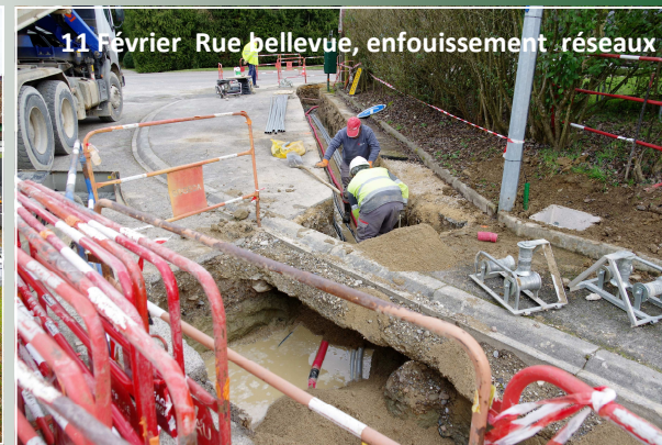
11 Février Rue Bellevue, enfouissement réseaux