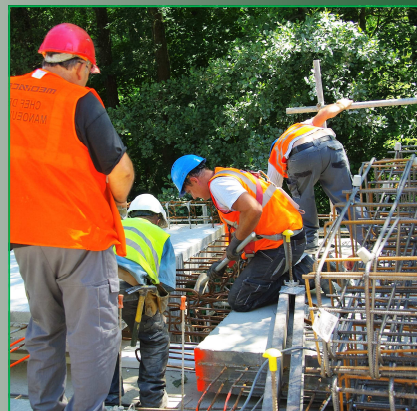
Le 19 Juillet, les éléments préfabriqués de la piste cyclables étaient posés.