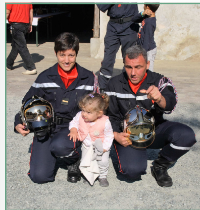
25 Septembre 2016

70ème anniversaire du Corps de Sapeurs Pompiers de Manspach