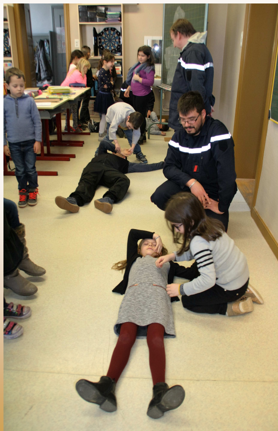
EXERCICES DE SECOURS A PERSONNES