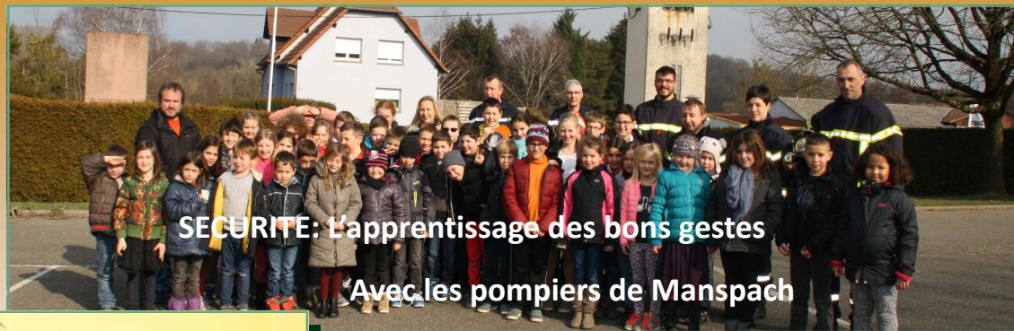
SECURITE: L'apprentissage des bons gestes Avec les pompiers de Manspäch