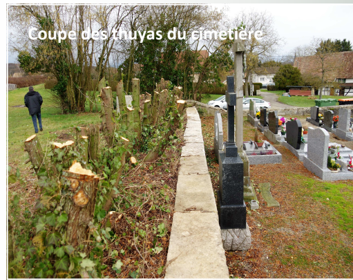
Coupe des thuyas du cimetière