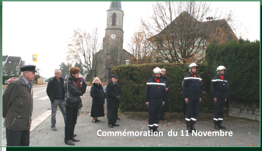
Comméoration du 11 Novembre