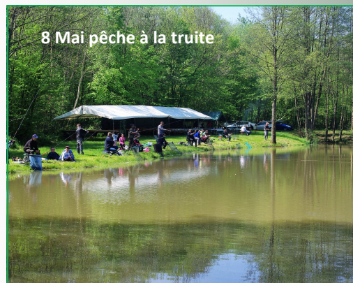
8 Mai pêche à la truite