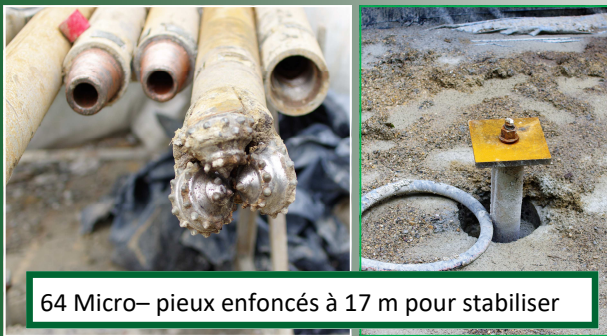
64 Micro-pieux enfoncés à 17 m pour stabiliser