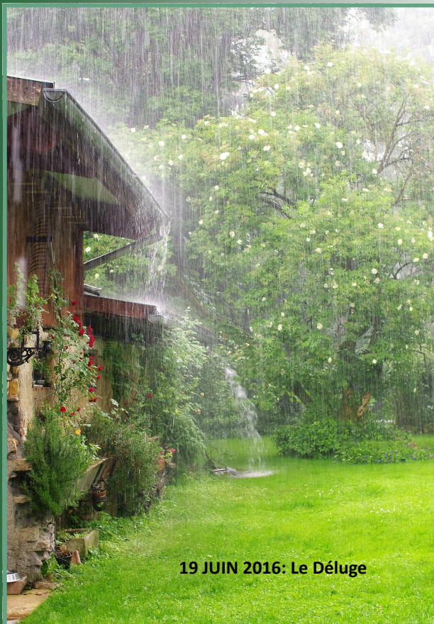
19 JUIN 2016: Le Déluge