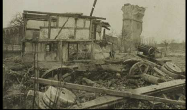
Ruines du moulin