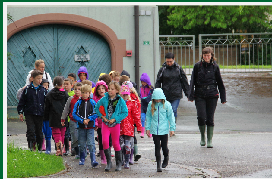
CLASSE D'EAU 2016 : Une séquence mémorable à la découverte du cycle de l'eau et de ses cortèges.