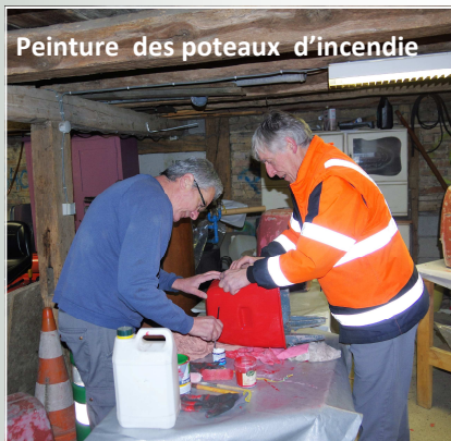
Peinture des poteaux d'incendie