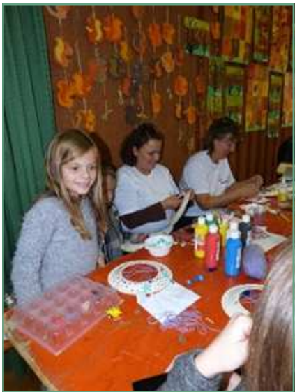
La conception d'attrape-rêves

La traditionnelle fête d'automne de l'association Tréma (tous réunis pour les écoles de Manspach-Altenach) a eu lieu vendredi 14 octobre. Un peu plus de deux-cents personnes, de toutes générations, se sont réunies à la salle de Manspach en ce vendredi soir.