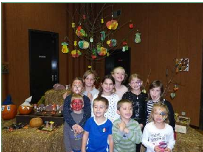
Les enfants devant les citrouilles décorées.

En attendant l'année prochaine, nous espérons vous revoir lors de nos prochaines manifestations, comme le loto qui aura lieu le samedi 25 mars 2017 et la kermesse qui aura lieu le samedi 24 juin 2017. L'association Tréma grâce à ces manifestations peut contribuer au financement de différents projets pour les élèves du RPI, ainsi en septembre 2015 elle avait transmis à l'OCCE de l'école la somme de 1 500€ et 4 000€ ont été versés avant la rentrée 2016 afin de permettre aux enfants d'en bénéficier pour l'année 2016-2017 qui commence. Sans oublier un merci aux bénévoles, aux enseignants, aux communes, aux parents et également un grand merci pour tous ceux et celles qui permettent chaque année la réalisation de ces projets !