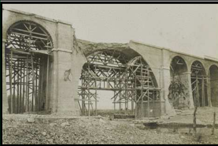
Une histoire mouvementée : Construit en 1860 pour la voie ferrée Paris-Bâle, il fut détruit et reconstruit quatre fois, en 1870 en 1914 en 1915, et en 1945.

Finale ment , le 30 mai 1915, deux jours après la fin des travaux de bétonnage, un tir de 51 obus de 420 mm allemands met fin aux espoirs français : le viaduc est à nouveau coupé et le moulin de « l'Aumühle » à jamais détruit.