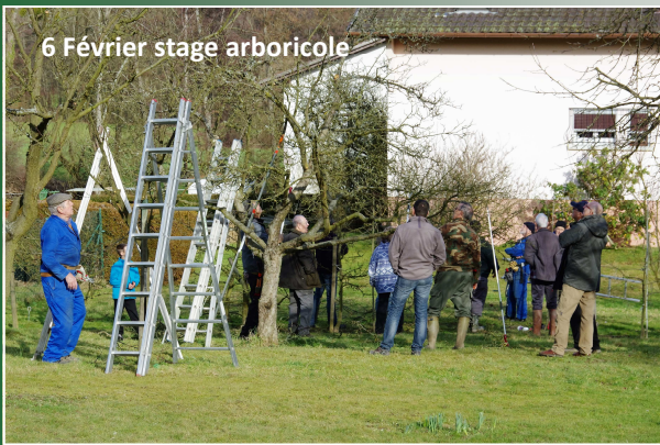
6 Février stage arboricole