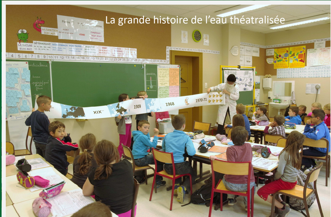
La grande histoire de l'eau théâtralisée