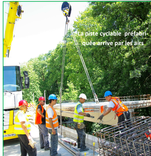
La piste cyclable préfabriquée arrive par les airs