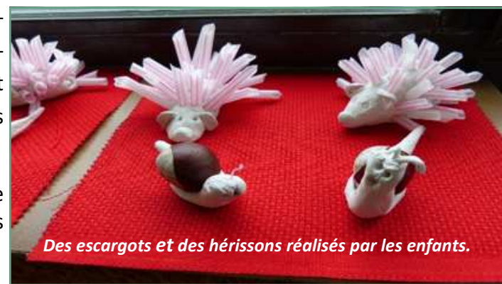
Des escargots et des hérissons réalisés par les enfants.

Le tout dans un décor automnal, en partie réalisé par les enfants de l'école, qui ont confectionné une véritable forêt, en passant par les arbres, les hiboux, les écureuils, et même de petits escargots