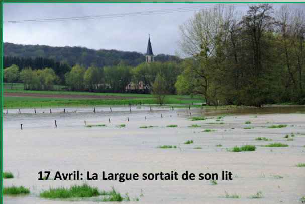
17 Avril: La Lague sortait de son lit