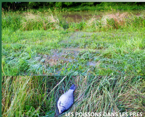
LES POISSONS DANS LES PRES